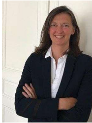
Mme Sandra BAREL

Magistrate issue de la promotion 2002, elle a été successivement nommée substitue du procureur de la République au tribunal de grande instance de Châteauroux, en 2004 ; puis au Mans en 2008. Nommée vice procureure de la République au tribunal de grande instance d'Orléans en 2012, elle rejoint l'Ecole en mai 2017 en tant que coordonnatrice de formation pour les fonctions « parquet ».